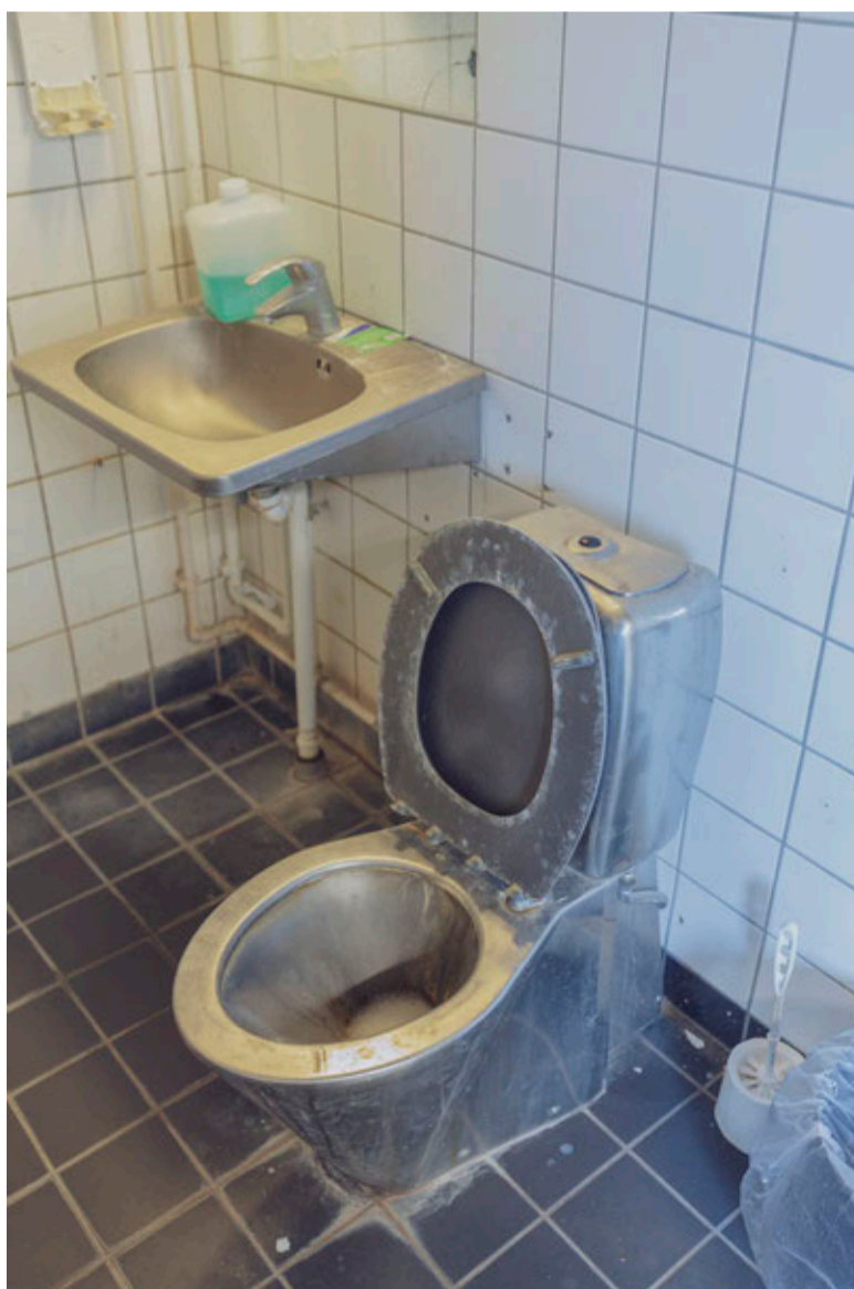
HYGIEJNE. Toiletforholdene i Ellebæk er ikke for de sarte. 'Manglende toiletter' var også en del af kritikken fra Torturkomiteens rapport.

Bange for My Boss. miriam.dalsgaard@pol.dk olav.hergel@pol.dk