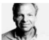
OLAV HERGEL, TEKST

Langfingeren på den 24-årige nigerianske kvinde Newton er brækket. En svensk sexkunde havde betalt, men var utilfreds med det, han fik for pengene, og ville have dem tilbage. Da hun ville undslippe, smækkede han døren, så fingeren kom i klemme og blev knust. Den vil aldrig kunne rettes ud, og det vil Newton heller ikke.