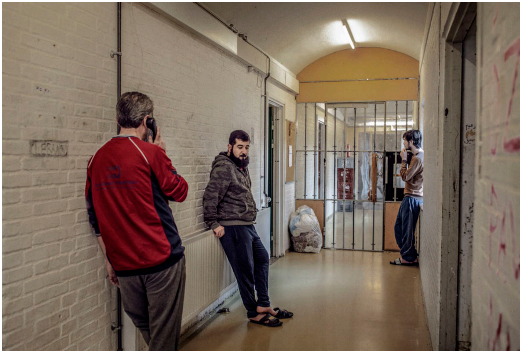
OPHOLD. Ellebæk er nedrasket og nedslidt. Mændene har ikke noget fællesrum. Derfor er de nødt til at opholde sig på gangene.

Man vedgår dog indirekte, at forholdene har været for ringe.