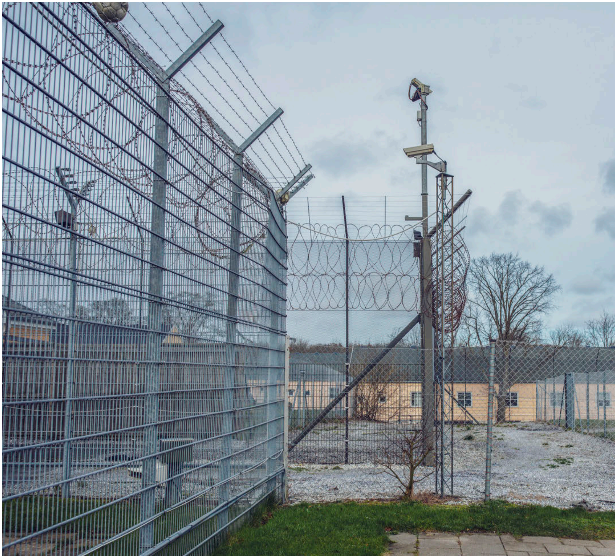
BAG TREMMER. Ellebæk er formelt set ikke et fængsel, men fungerer sådan. De afviste asylansøgere har ikke gjort noget kriminelt, men myndighederne frygter, at de går under jorden.