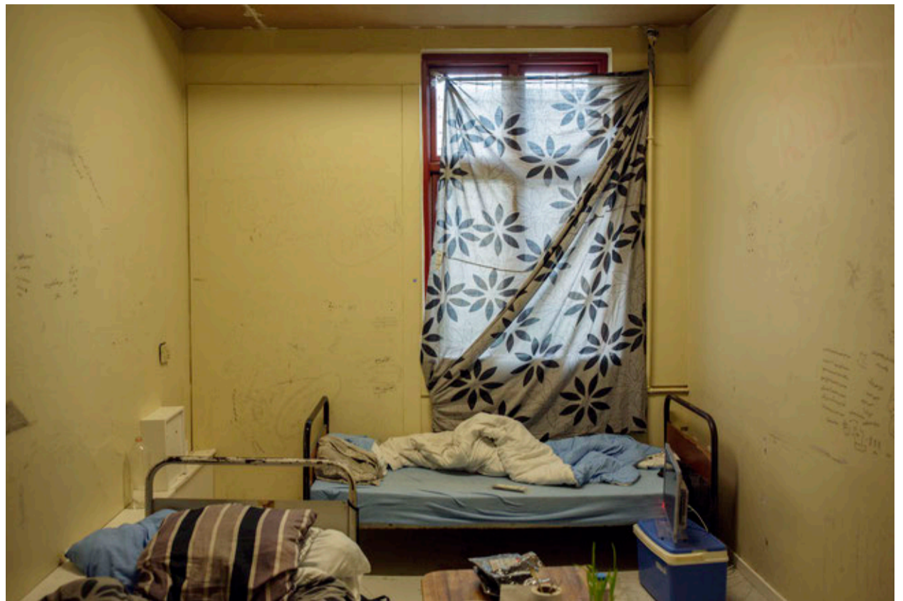
RENOVERING. Mens kvindernes afdeling blev istandsat for syv år siden og er pæn – også fordi kvinderne i modsætning til mændene er gode til at gøre deres afdeling rent – er forholdene på mændenes afdeling miserable. Blandt andet på grund af kritikken fra Europarådets Torturkomité har regeringen bevilget penge til at forbedre faciliteterne.